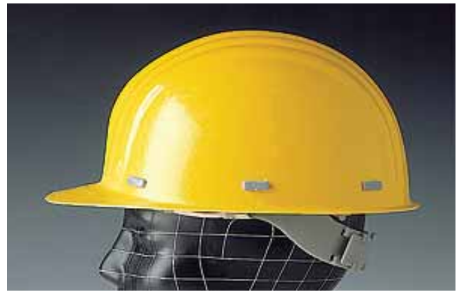
Außenschale: gerade Helmform